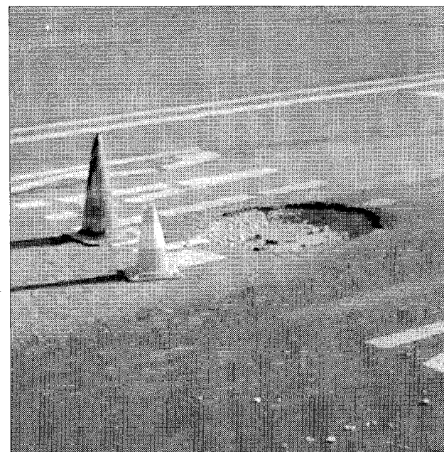
La voragine transennata in Via Palestrina

tuire apposita segnalazione di senso unico alternato in attesa del 'rattoppo'. Tuttavia, nonostante l'emergenza, il Comune non ha ancora provveduto alla riparazione. Si spera che quanto prima si provveda alla riparazione.