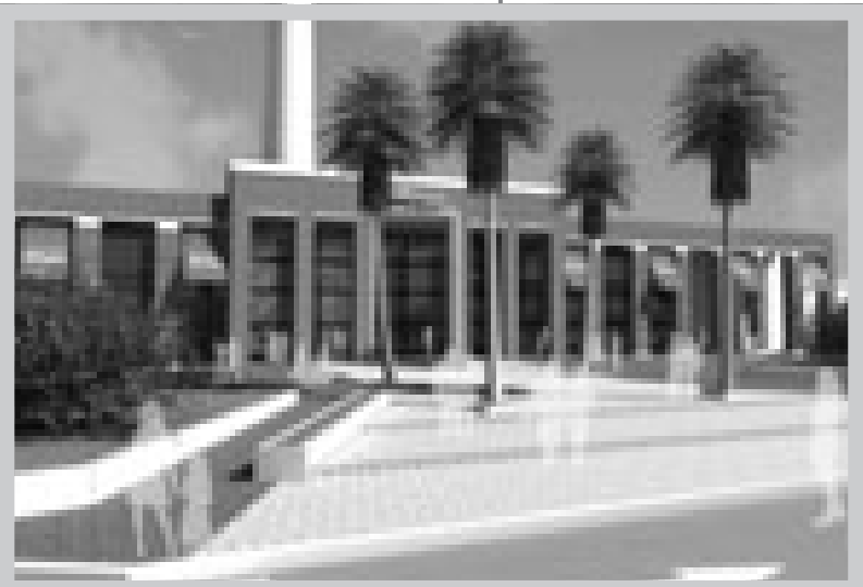
Il centro commerciale Mesa di Pontinia al centro di un dibattito che dura da anni