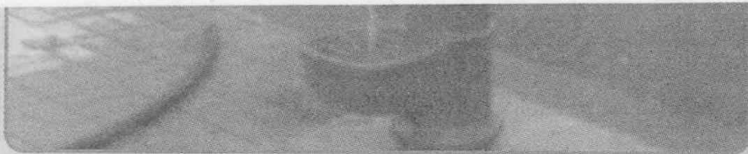
UNA FONTANELLA A GETTO CONTINUO IN Q4